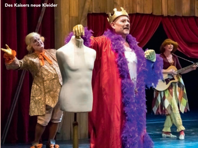
Des Kaisers neue Kleider